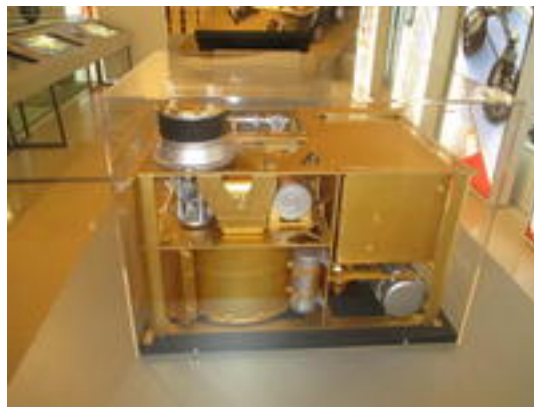
Sample Analysis at Mars